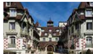
Le Normandy ****