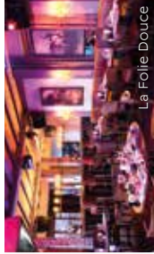
La Folle Douce