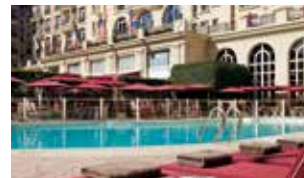
Le Royal *****