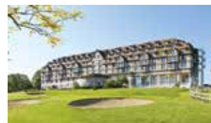
LHôtel du Golf ****